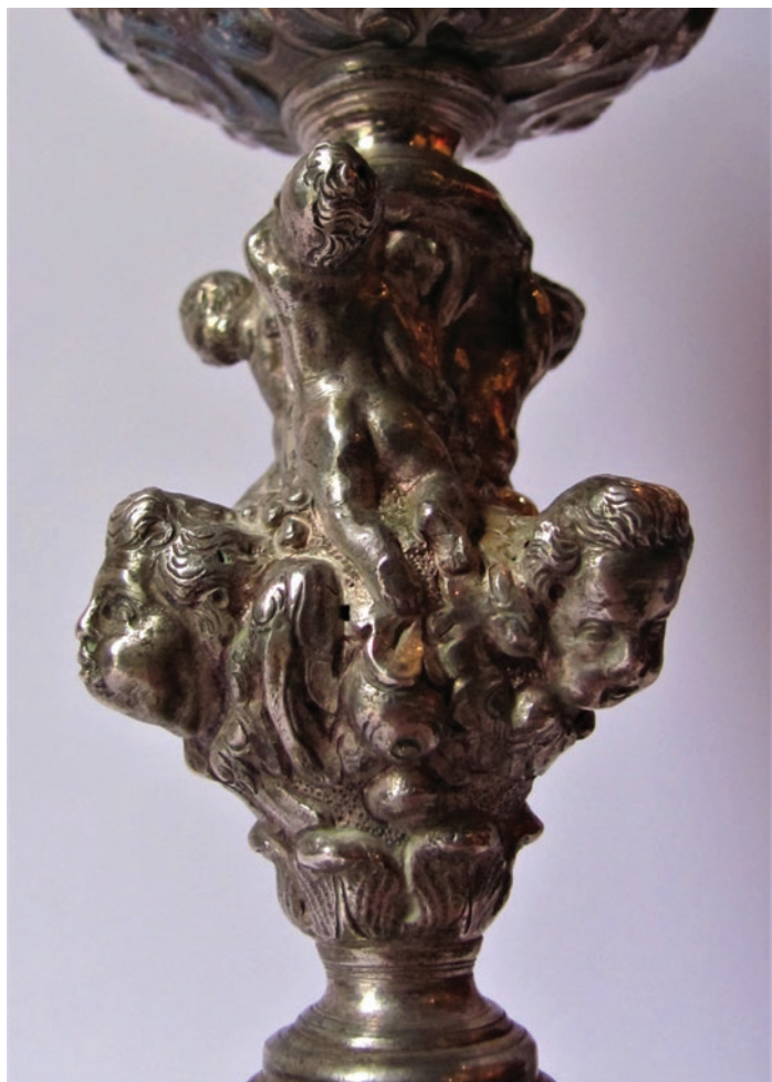
Nepoznata venecijanska zlatarska radionica, Kalež (detalj), 1. polovica 18. stoljeća, Osor