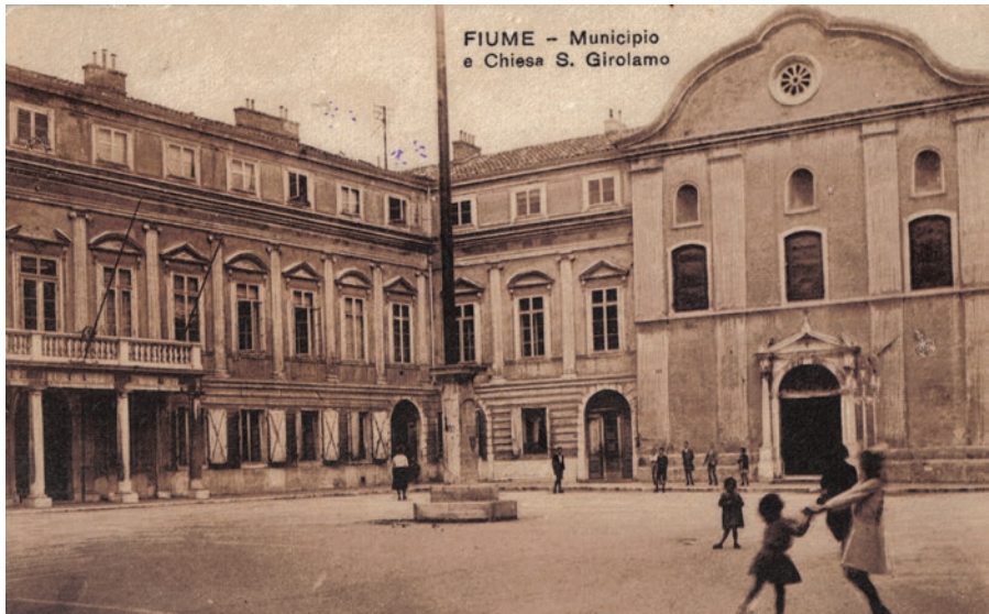
Piazza Municipio (danas Trg Riječke rezolucije) s crkvom sv. Jeronima i nekadašnjim augustinskim samostanom, kraj 19. ili početak 20. stoljeća