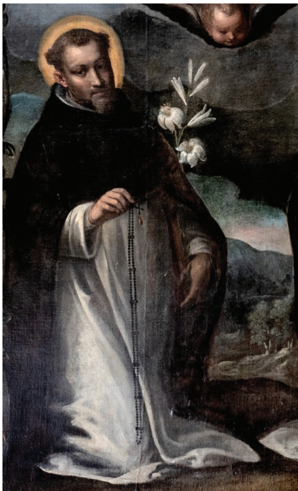
Giovanni Ludis, Gospe od Ružarija (detalj), prije 1628., Interpretacijski centar katedrale Sv. Jakova Civitas Sacra , Šibenik